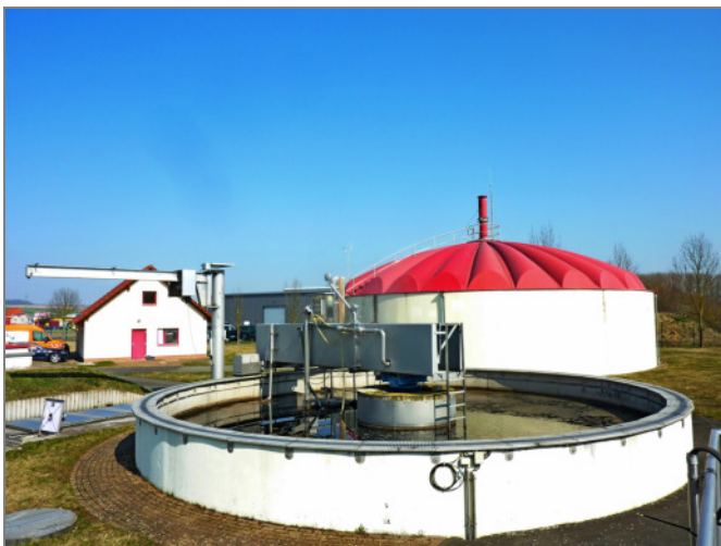
Blick auf die Kläranlage