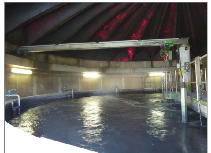
Blick auf die Biologische Abwasserreinigung

Das nun vorliegende Energie-Konzept zielt auf einen sparsamen Umgang mit der Ressource Energie, senken der Treibhausgas-Emissionen und leistet einen wertvollen Beitrag zum Klimaschutz sowie der Daseinsvorsorge.